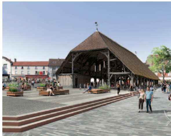
La Halle du Marché