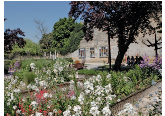
Jardin rue Grande