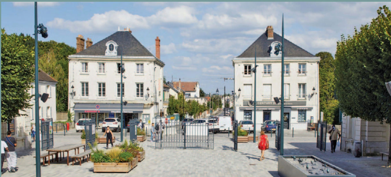
Le Cœur de Ville

La ville développe actuellement un grand projet d'aménagement urbain au cœur de la ville. Avec le projet Cœur de Ville, le Bourg millénaire verra sa richesse patrimoniale et son ancrage commercial confortés, grâce à des espaces publics facilitant les mobilités et favorisant l'équilibre entre ville et nature.